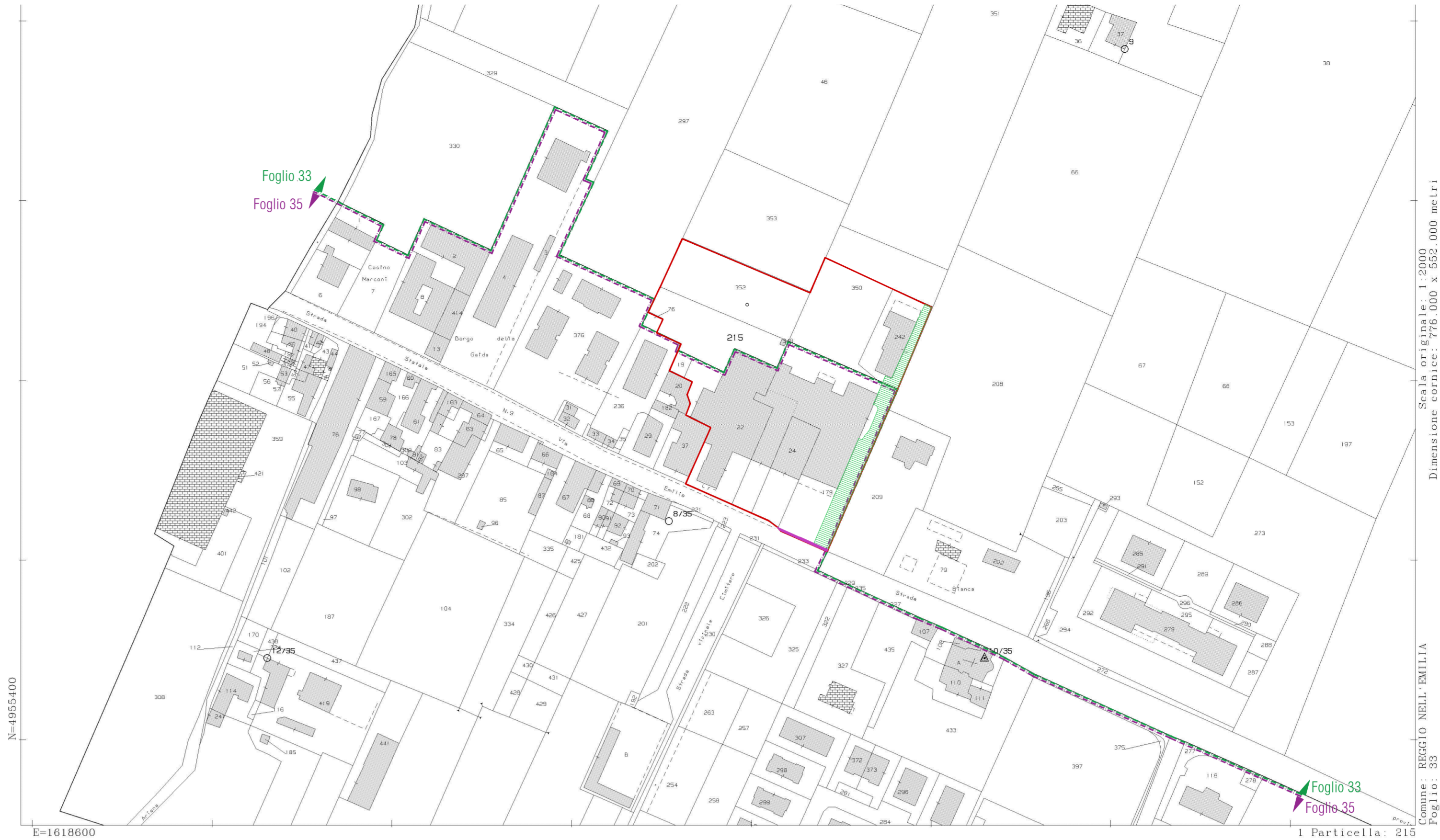
ESTRATTO CATASTALE scala 1:2.000

— ambito di progetto Superficie area di progetto: 15.196,00 m 2 foglio 35, mapp.i: 19, 22, 24, 179 foglio 33, mapp.i: 215, 242, 349, 350(parte), 352