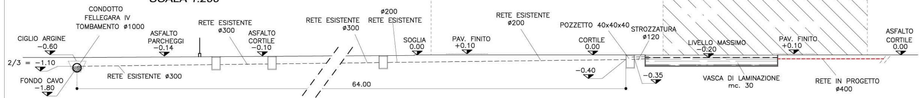
TAVOLA SCARICHI ACQUE BIANCHE