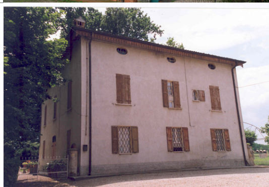
Prospetto nord.