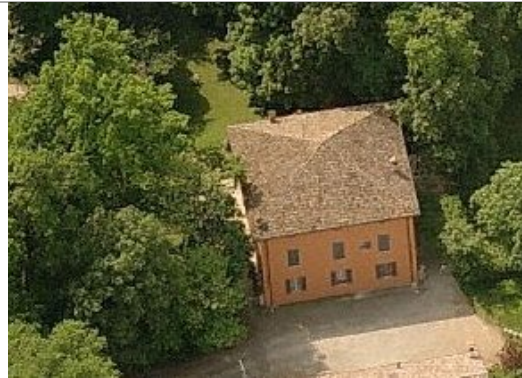
Vista da nord