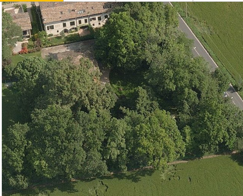
vista da sud del piccolo parco che circonda il casino