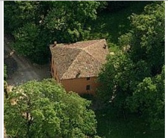
Vista da ovest

INQUADRAMENTO TERRITORIALE base cartografica BTU scala 1:5000