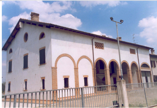
cod. 23A01-1 Edificio a : vista da sud-ovest del rustico