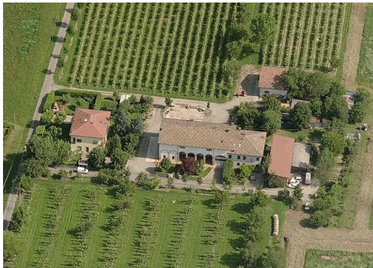
Vista da sud

INQUADRAMENTO TERRITORIALE base cartografica BTU scala 1:5000