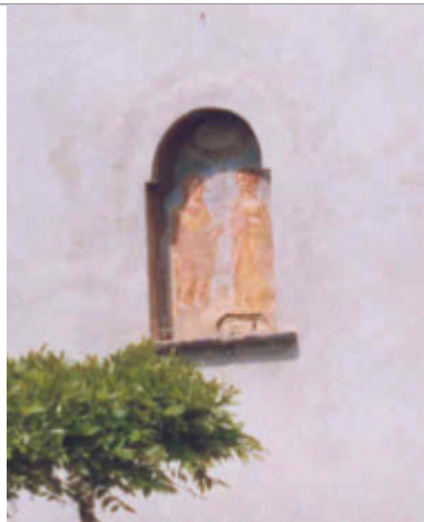
Nicchia con affresco sul prospetto sud del civile.