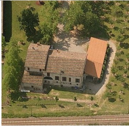
Vista da nord