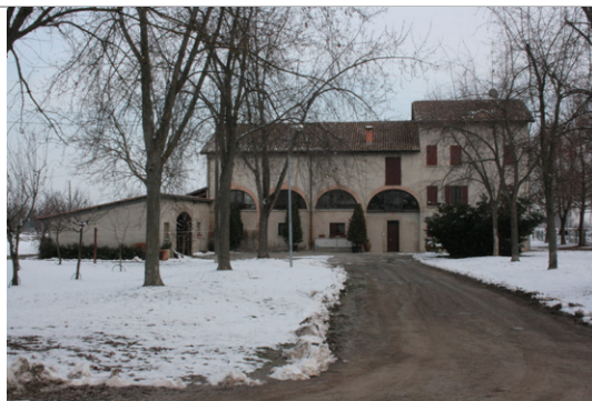
Vista da sud dell'edificio