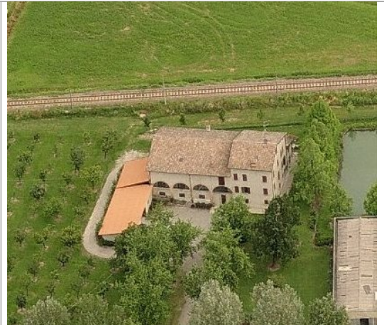
Vista da sud

INQUADRAMENTO TERRITORIALE base cartografica BTU scala 1:5000