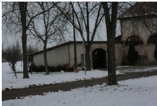
Vista del basso servizio addossato ad ovest dell'edificio