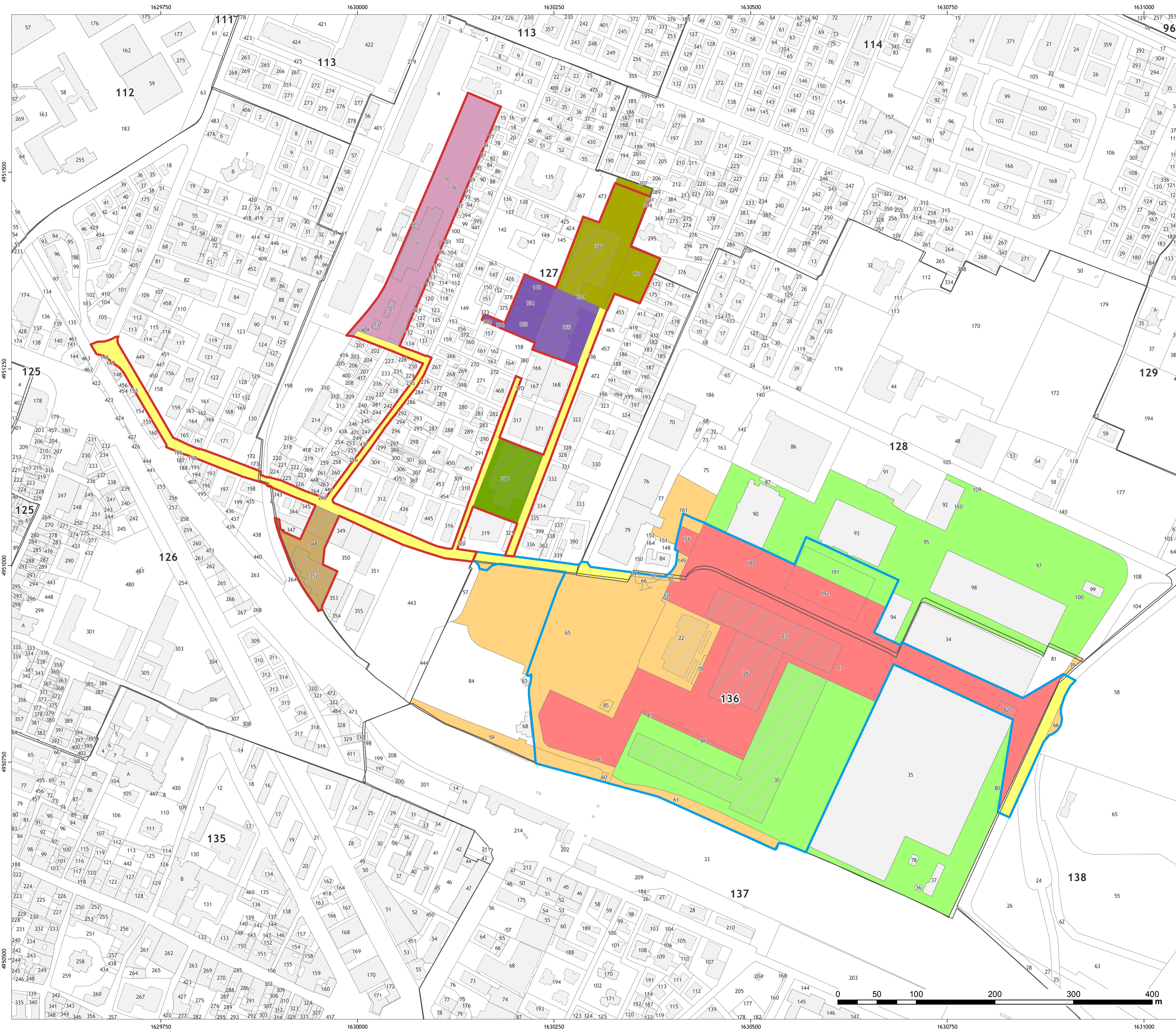
Inquadramento elaborato dagli uffici comunali con base cartografica ottenuta da unione di fogli catastali aggiornati al 07 novembre 2017