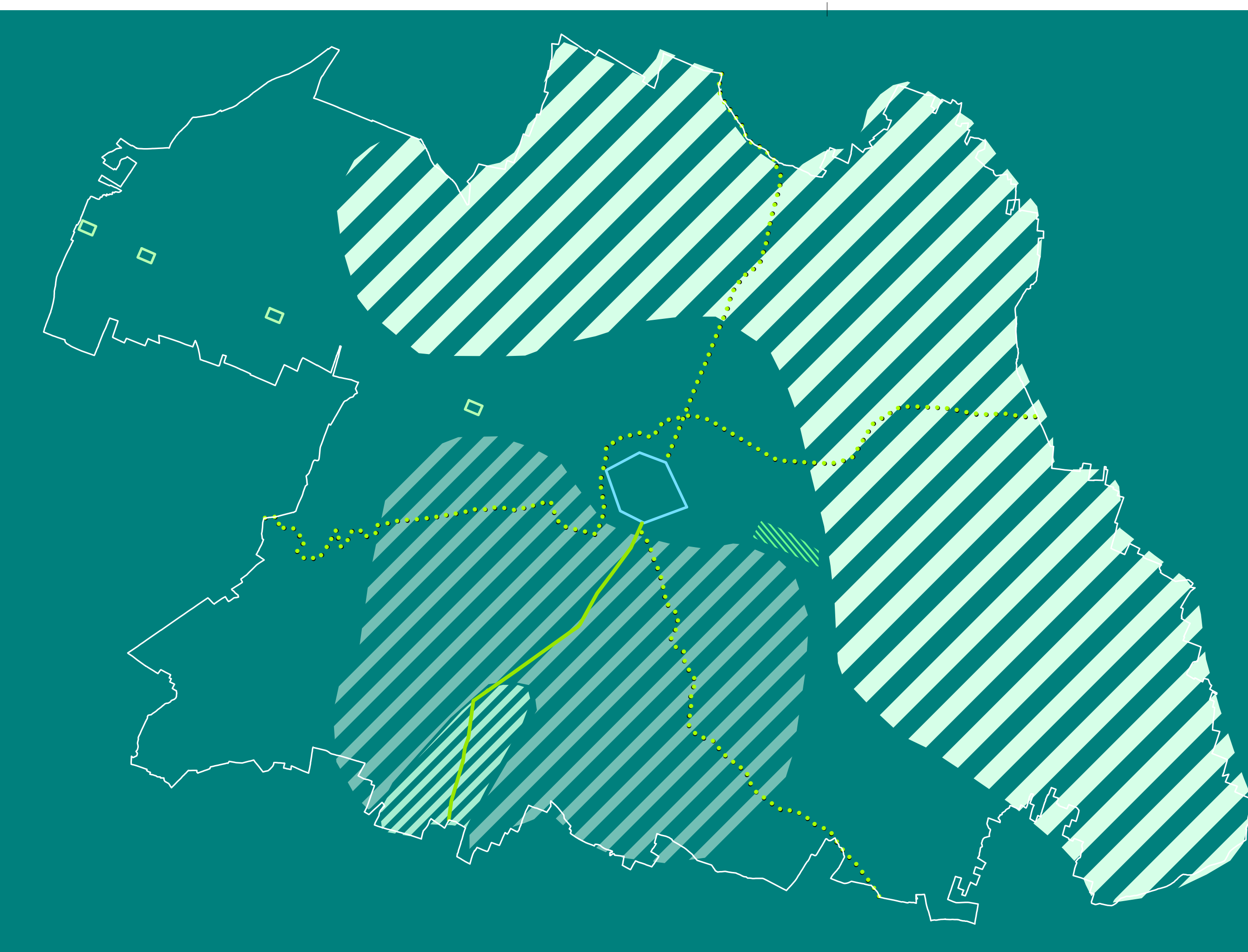
età moderna (XV-XIX sec.)